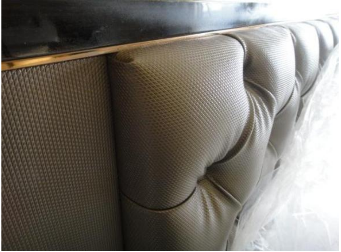
△金属镇边条与软包、硬包交接示图